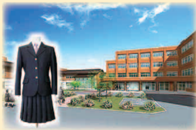
校舎正面と女子制服 男子制服は標準服